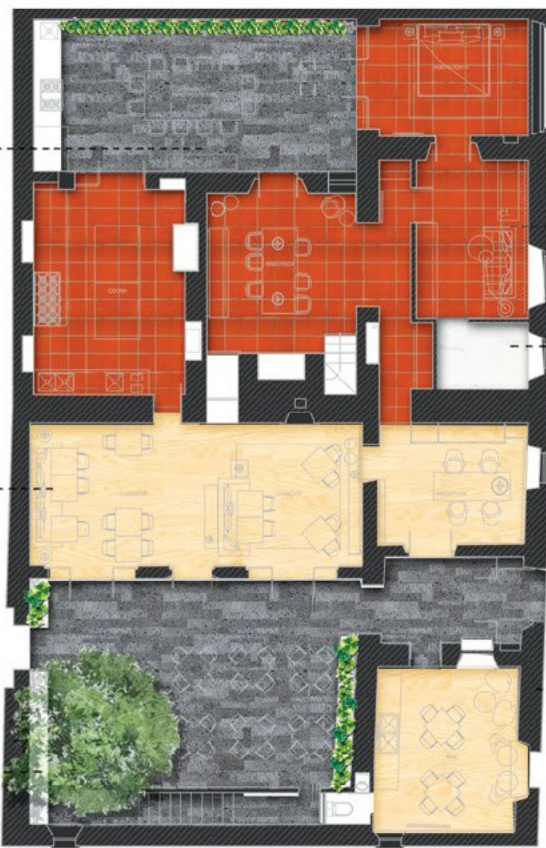
MATERIALES PLANTA BAJA