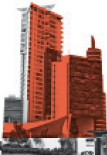
Central Park Querétaro