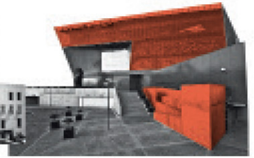
Corporativo Banorte Monterrey