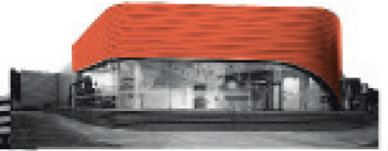
Centro de contacto DF